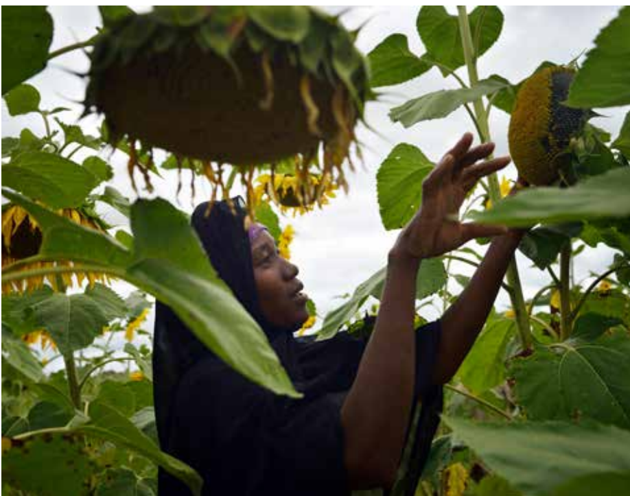
Une productrice tanzanienne évalue la future récolte de tournesols