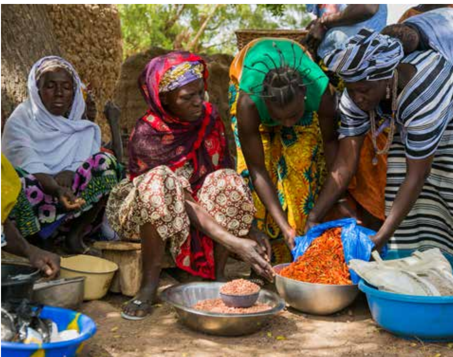
Marché agricole à l'ombre d'un arbre au Mali

conseil d'administration / comité de direction, les activités par lesquelles le partenaire démontre son aptitude à travailler efficacement et équitablement avec les femmes, les hommes et les personnes socialement défavorisées, sa capacité à collecter de manière avérée des données ventilées par sexe et l'existence de systèmes de suivi et d'évaluation.