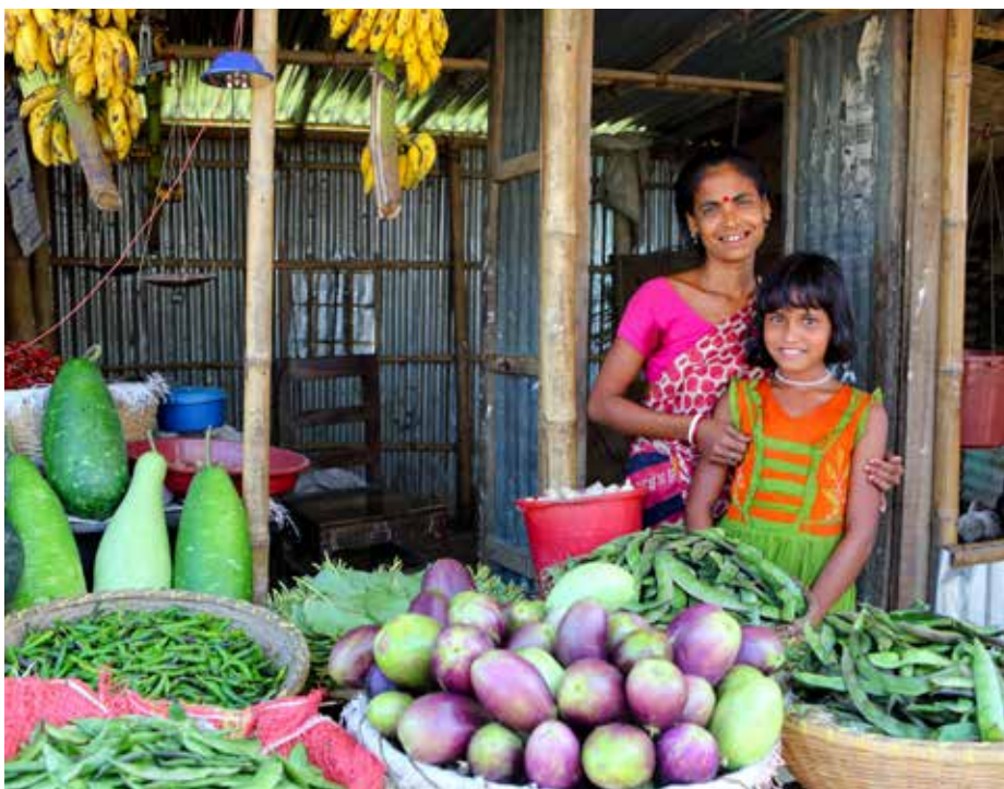
Vente de légumes : une source de revenus précieuse pour une mère et sa fille au Bangladesh

d'enfants ont augmenté et les femmes ont ainsi eu plus de temps à disposition pour se consacrer aux tâches productives, telles que l'élevage de petits animaux. Toutes les autres interventions ciblaient à la fois les hommes et les femmes (intégration de la dimension genre).