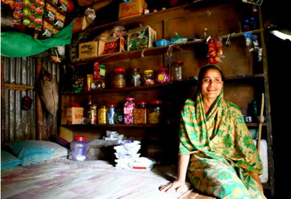
Lorsque le domicile fait également office d'épicerie au Bangladesh

Swiss Agency for Development and Cooperation SDC