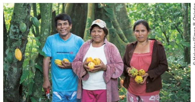
Recolección de cacao silvestre en Bolivia.

Uno de los conflictos principales se relaciona con la gestión de rellenos sanitarios. En municipios con reducidas capacidades técnicas, los rellenos sanitarios usualmente son botaderos a cielo abierto, con escasa o nula gestión, cercanos a cursos de agua, lo cual produce contaminación afectando la salud de la población especialmente de los más vulnerables. Las poblaciones