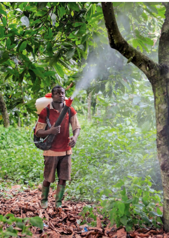
Kakaoanbau in Ghana. Die KVI will, dass Schweizer Konzerne Mensch und Umwelt besser schützen.

Der bundesrätliche Gegenvorschlag zur neuen Konzernverantwortungsinitiative lässt zahlreiche Schlupflöcher offen. Darum braucht es jetzt öffentlichen Druck für Nachbesserungen.