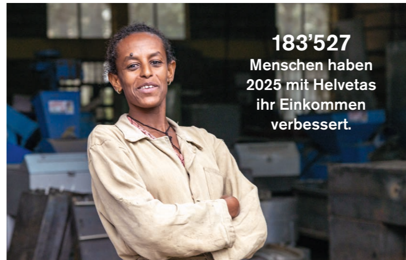
Hagire Analaye aus Äthiopien ist eine von ihnen.