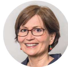
Von Regula Rytz

Vor vier Jahren habe ich das Präsidium von Helvetas übernommen. Und entdecke jeden Tag neue Gründe, um mich für die älteste Entwicklungsorganisation der Schweiz einzusetzen. Die starke lokale Verankerung zum Beispiel. Seit jeher wird unsere Arbeit von den Menschen und den Organisationen vor Ort getragen. Oder die Süd-Süd-Kooperation. Ingenieur:innen aus dem nepalesischen Hängebrückenprogramm wenden ihr Wissen nun in Äthiopien an. Und zwar im Rahmen eines Start-ups, das Helvetas unterstützt. Ganz besonders berührt mich der Mut unserer Mitarbeitenden in Krisenregionen. Immer wieder höre ich: «Helvetas ist dort, wo niemand sonst hingeht.» In den abgelegensten Dörfern in Haiti zum Beispiel. Oder in Myanmar, wo sich politische Konflikte mit den Folgen eines schweren Erdbebens überschneiden. Kurzerhand hat Helvetas humanitäre Aktivitäten in die langfristigen Entwicklungsprojekte integriert. All dies können wir nur tun, weil Sie, werte Leserin, geschätzter Leser, uns den Rücken stärken. In einer Welt, die immer unsicherer wird, bleiben Sie solidarisch mit Menschen, die es sich nicht leisten können, die Hoffnung zu verlieren. Danke für diesen Kompass! ○