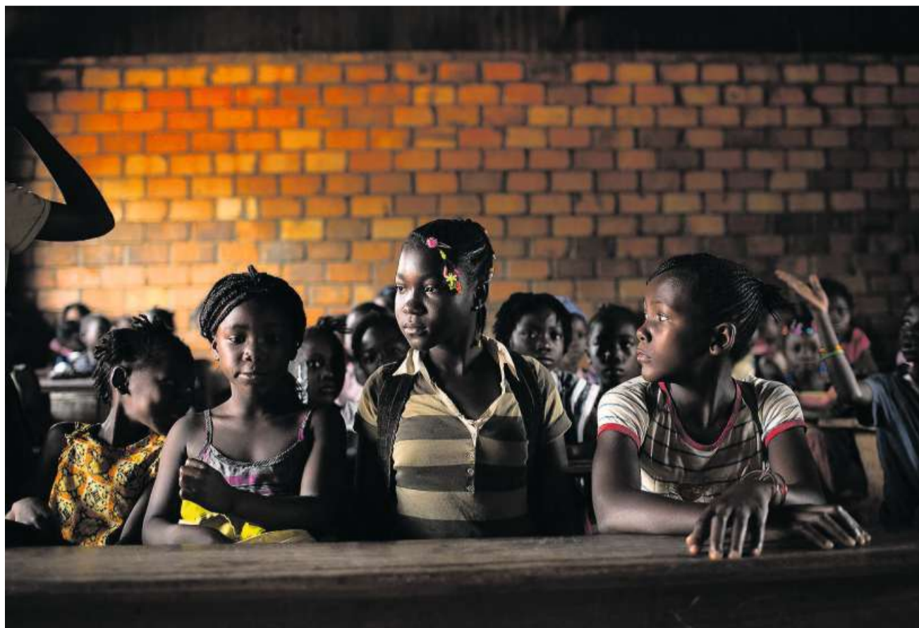
Für viele Mädchen in der Sahelzone ist Bildung die einzige Chance, ihr Schicksal in die eigenen Hände zu nehmen.

Zu den Zielen der Terroristen gehört es, die Schüler und die Eltern einzuschüchtern, damit die Kinder der Schule