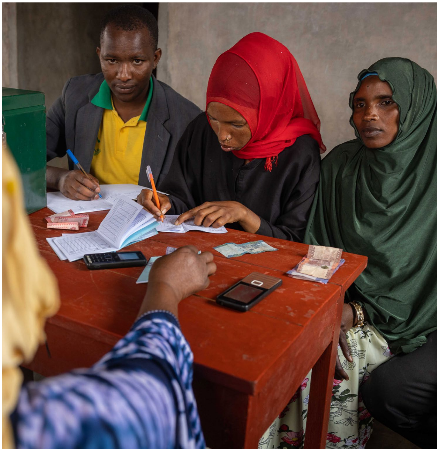
Ein Unternehmenskollektiv in Kinyeto (Tansania) bei der Buchführung.