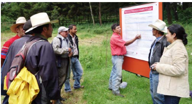
Les audits publics conjoints offrent un espace de discussion sur les défis et les réalisations concrètes tout au long de la mise en œuvre.

Alors qu'une redevabilité verticale accrue peut être demandée par les citoyens ou peut être fournie par les gouvernements, les organisations de développement entretiennent également des relations de redevabilité. Nous avons une redevabilité vis-à-vis des personnes dont nous recherchons à améliorer les vies et les revenus à travers nos activités, mais également vis-à-vis des personnes et des institutions qui nous ont confié les moyens de le faire.