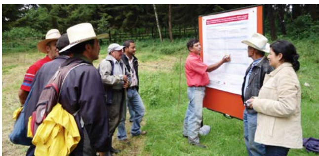
Las auditorías públicas conjuntas proporcionan un espacio para discutir desafíos prácticos y logros en la implementación.

Aunque los ciudadanos pueden exigir una mejora de la responsabilidad vertical y los Gobiernos pueden proporcionarla, las organizaciones de desarrollo también forman parte de las relaciones de responsabilidad. Así pues, rendimos cuentas a las personas cuyas vidas y subsistencias queremos mejorar a través de nuestras actividades, pero también a las personas e instituciones que nos han confiado los medios para hacerlo.