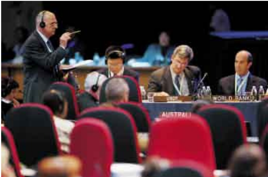
De plus en plus, les problèmes de l'eau préoccupent des politiciens au plus haut niveau: des délégués lors d'une réunion de travail au Sommet mondial de Johannesburg en 2002.

■ ■ ■ La controverse est née (non sans fondement) de la crainte que les ressources en eau se trouvent prises dans le tourbillon du mouvement international en faveur de la privatisation, lequel est encouragé par le FMI et la Banque mondiale et salué par l'économie privée. Car parallèlement à la reconnaissance de la valeur économique de l'eau inscrite dans les Déclarations de Dublin et dans l'Agenda 21, l'intérêt pour l'eau potable comme bien économique et comme marchandise a grandi dans les années 90.